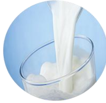
ماء خلط بحليب